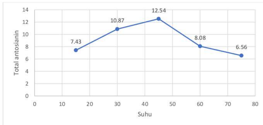
Gambar 3. Hasil optimasi suhu

Serta kebalikannya, bila ekstraksi melamin antosianin pada temperatur besar hendak menciptakan kandungan antosianin yang lebih kecil. Perihal ini diakibatkan sebab temperatur pada ekstraksi melamin antosianin mempengaruhi kepada kandungan antosianin ataupun kemantapan warna melamin. Temperatur ekstraksi yang sangat besar hendak memunculkan dampak pemucatan pada warna melamin natural, sebab terus menjadi besar temperatur hingga bisa menimbulkan hilangnya glikosil pada antosianin dengan menghidrolisis jalinan glikosidik alhasil aglikon yang diperoleh kurang normal serta menimbulkan lenyapnya warna pada antosianin pada kol ungu. Angka absorbansi hendak mengarah turun bersamaan dengan ekskalasi temperatur pemanasan. Pada temperatur 75 0 C, angka absorbansi ekstrak zat warna sangat kecil di antara alterasi temperatur yang lain. Winarno (2002), dipaparkan kalau menyusutnya angka absorbansi ekstrak zat warna pada temperatur besar diakibatkan sebab sudah terjalin pembusukan antosianin dari wujud aglikon jadi kalkon( tidak bercorak). mengatakan kalau ekskalasi temperatur menimbulkan lepasnya gabungan glikosil dari antosianin sebab hidrolisis jalinan glikosidik. Oleh sebab itu, pemanasan yang terbaik merupakan pada temperatur 45 0 C, dimana angka absorbansinya sangat besar di antara ketiga temperatur yang lain. Semakin lama waktu ekstraksi semakin banyak antosianin terekstrak namun, dapat menyebabkan kerusakan pada antosianin yang dihasilkan.