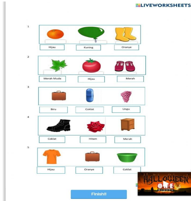
Gambar 3. Pencocokan gambar dan warna pada liveworksheet

Pada Gambar 3 pengajar membahas tentang pencocokan antara gambar dan warna yang akan diterapkan pada materi kelas I di SDN 3 Buluagung, dimana pengajar menggunakan “drop and drag” untuk pencocokan soal. Jika ada yang salah maka akan terlihat kesalahan.