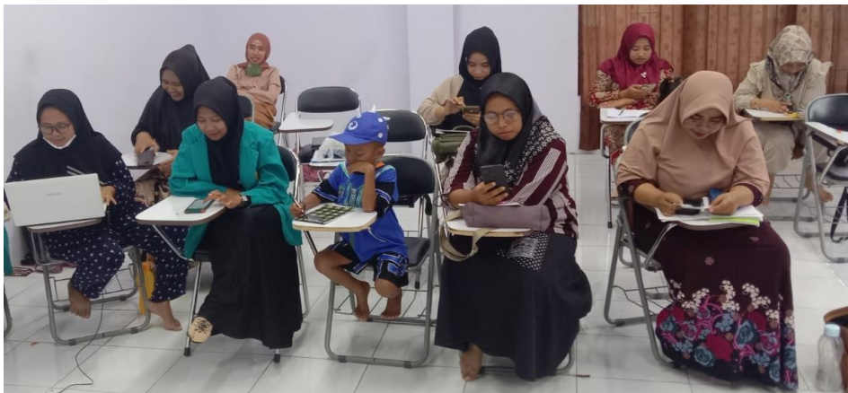
Gambar 1. Penyampaian Materi oleh Pendamping

Pada fase Evaluasi ini peserta pendampingan diberikan kesempatan menulis kesan dan pesan tentang kegiatan pengabdian ini pada secarik kertas guna untuk mengetahui keefektifan pengunaan platform liveworksheet . Peneliti juga menyebarkan angket dan kuisisioner terkait penggunaan liveworksheet dengan google form di SDN 3 Buluagung.