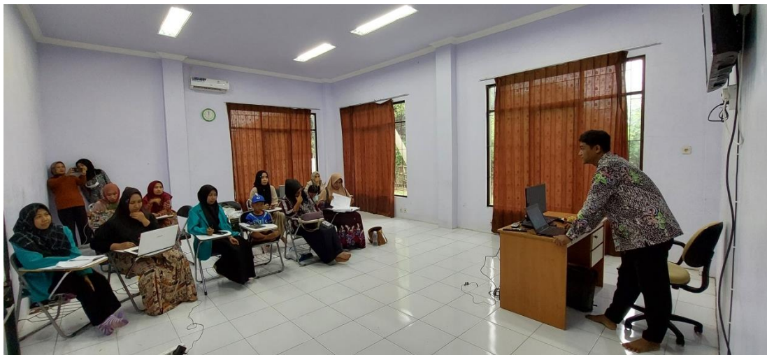
Gambar 4. Peneliti menyampaikan Materi liveworksheet

Pada Gambar 3 pengajar membahas tentang pencocokan antara gambar dan warna yang akan diterapkan pada materi kelas I di SDN 3 Buluagung, dimana pengajar menggunakan “drop and drag” untuk pencocokan soal. Jika ada yang salah maka akan terlihat kesalahan.