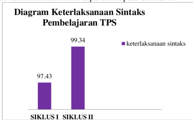
Gambar 1. Diagram keterlaksanaan sintaks pembelajaran Think Pair Share (TPS)

Berdasarkan observasi yang dilakukan dari lembar keterlaksanaan sintaks pembelajaran think pair share (TPS) oleh dosen dan mahasiswa dari siklus I 97,43 dan siklus II 99,34. Diketahui dari hasil siklus I dan siklus II terjadi peningkatan sebesar 1,92%. Diagram keterlaksanaan sintaks dapat dilihat pada Gambar 1.